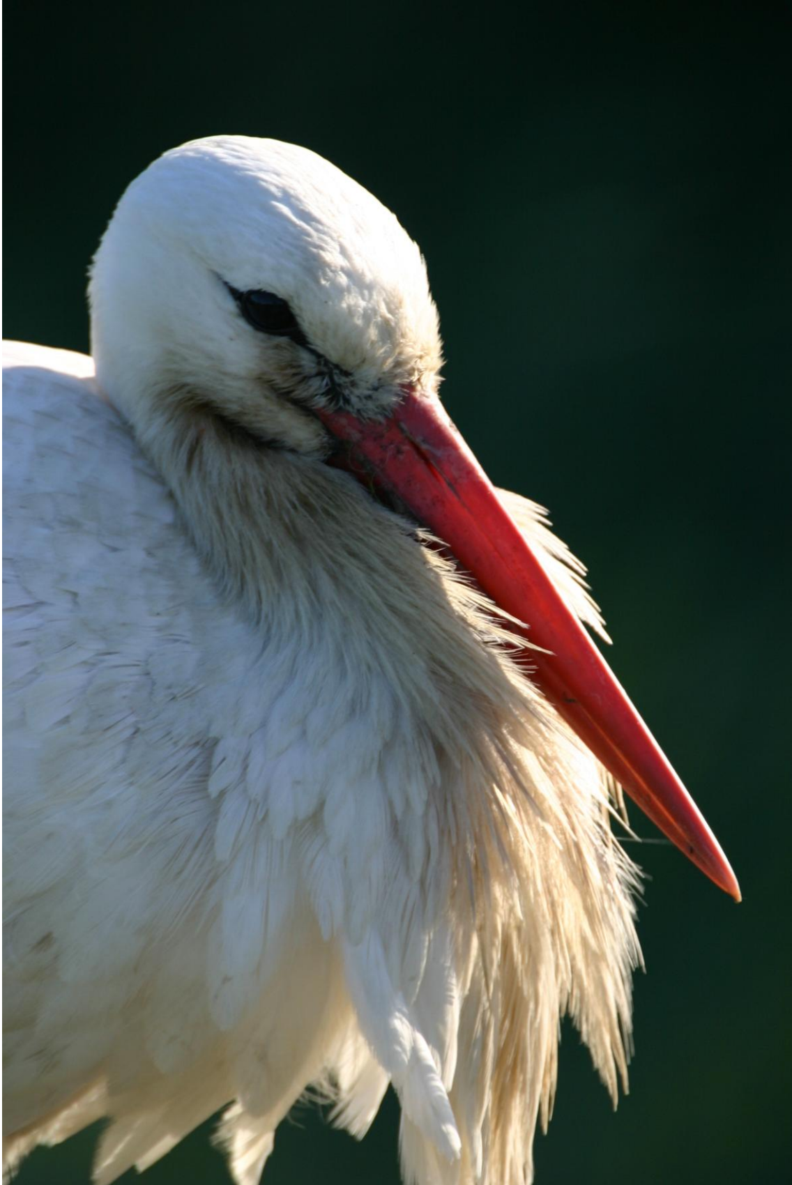
Mei, 2015. It Eibertshiem. Blijf ons volgen via www.ooievaars.nl en via Facebook ooievaars.nl