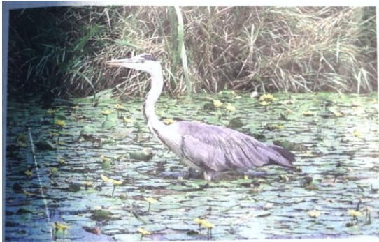
Blauwe reiger vormt een bedreiging voor weidevogels.